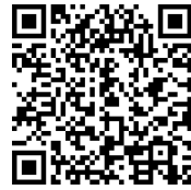
für Android (Samsung)

Grundsätzlich funktionieren alle Apps mit OTP-Funktion (One-Time-Passwort-Funktion).